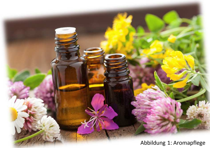
Abbildung 1: Aromapflege