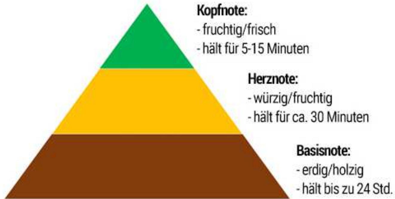
Abbildung 2: Duftnoten