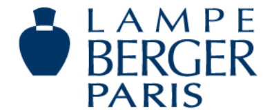
Abbildung 2: Lampe Berger