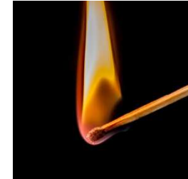
Abbildung 1: Streichholz