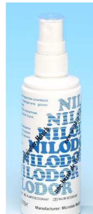
Abbildung 3: Nilodor Spray